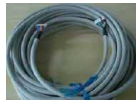
合成繊維仮燃機用