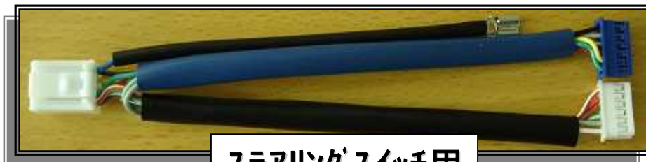
ステアリングスイッチ用