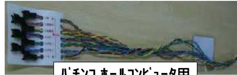
パチンコホールコンピュータ用