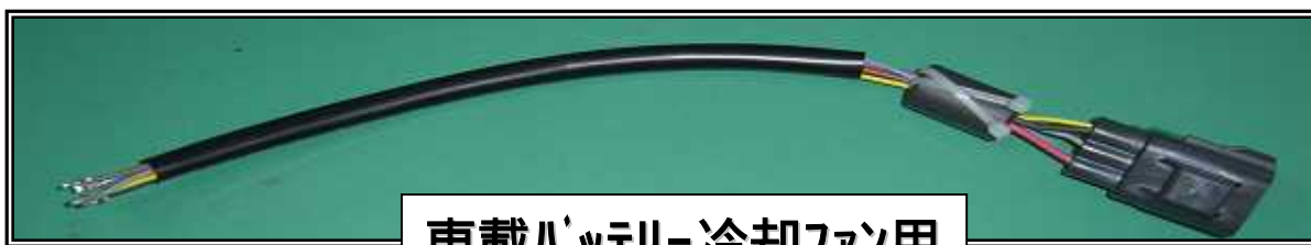
車載バッテリー冷却ファン用